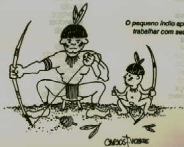
O pequeno índio aprende a trabalhar com seu pai.